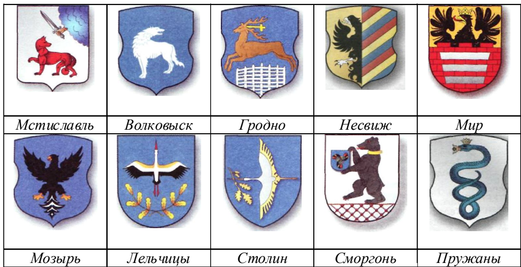
Рис. 1. Гербы городов (животные)

Объектами поклонения из числа животных всегда были медведь (герб Сморгони), волк (Волковыск, Логошин, Мстиславль; Логишинский волк с лосиными ногами, Мстиславский - с красной лисьей шерстью), рысь (Гомель, Белица), олень (Гродно; олень святого Губерта с крестом между рогами), орёл (Несвиж, Мозырь, Мир), уж (Пружаны) [23].