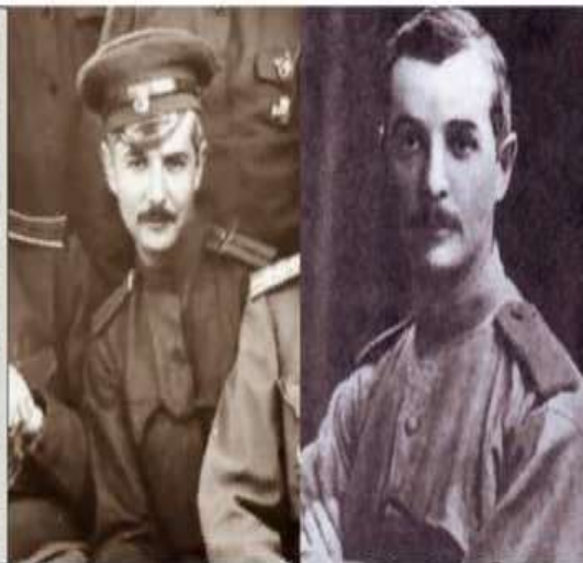
Саша Черный в военной форме