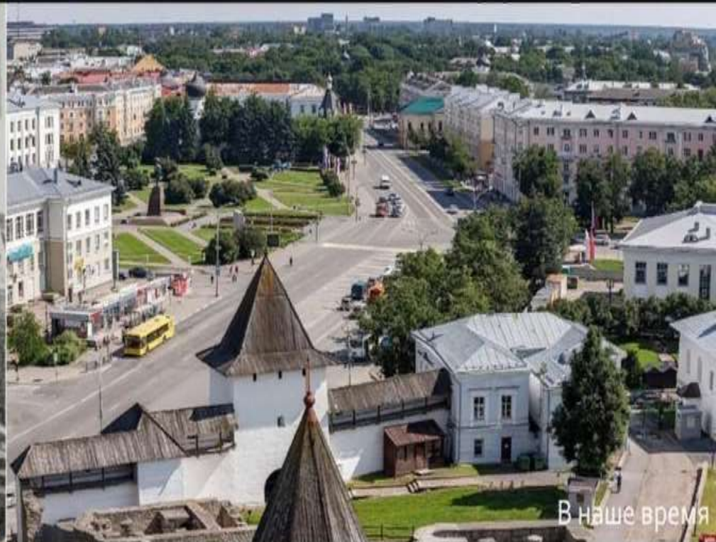
В наше время