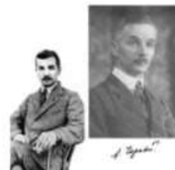
Саша Черный 1880 – 1952 гг.

Дорогие друзья! Для более подробного знакомства с данной темой, мы приготовили для вас стильно и презентажно. Вы можете навести камеру смартфона на QR – код и перейти в документ с ценной и наглядной информацией. Приятного чтения и просмотра!