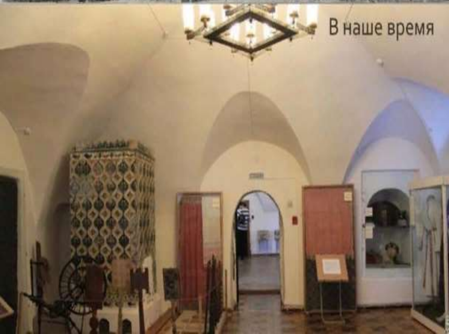
В наше время