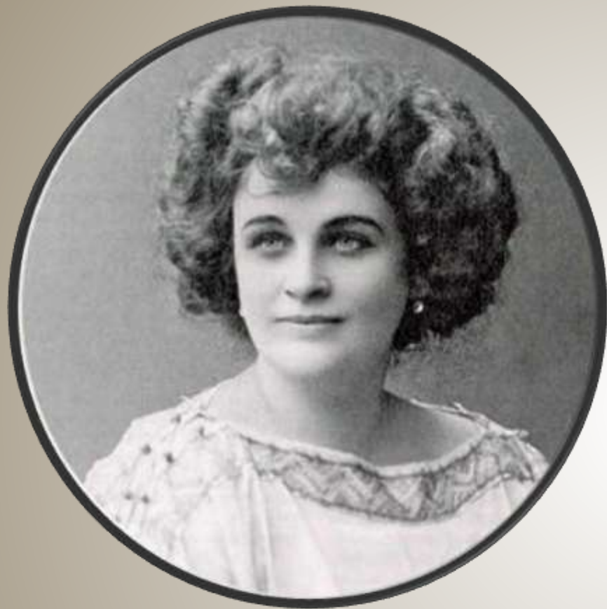
Н.А. Тэффи 1872-1952