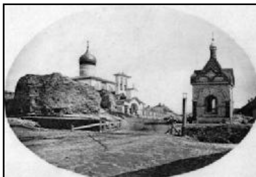
Снимок из альбома.