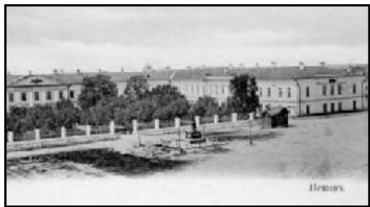
Здание Присутственных мест.

сутственных мест, где губернатор отвёл для неё помещение при Статистическом комитете, и открыли 1 января 1870 года.